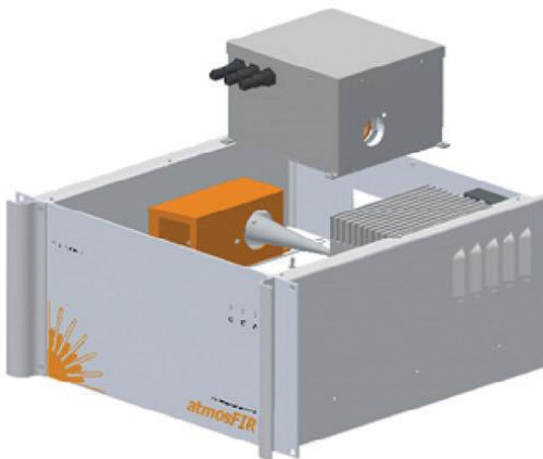
Ryc. 2. Wyjmowany pojemnik na komorę pomiarową dla ułatwienia obsługi.

atmosFIRi może być dostarczony w obudowie do stojaka 19" lub w wersji do montażu na ścianie. Podstawowa jednostka pomiarowa musi być zainstalowana w obszarze bezpiecznym, natomiast do analizatora mogą być pobierane próbki gazów niebezpiecznych, zgodnie z normą BS EN 60079-Część 2. Zasady dotyczące przepływu, hermetyzacji i rozcieńczania gazu są brane pod uwagę podczas projektowania układu pomiarowego.